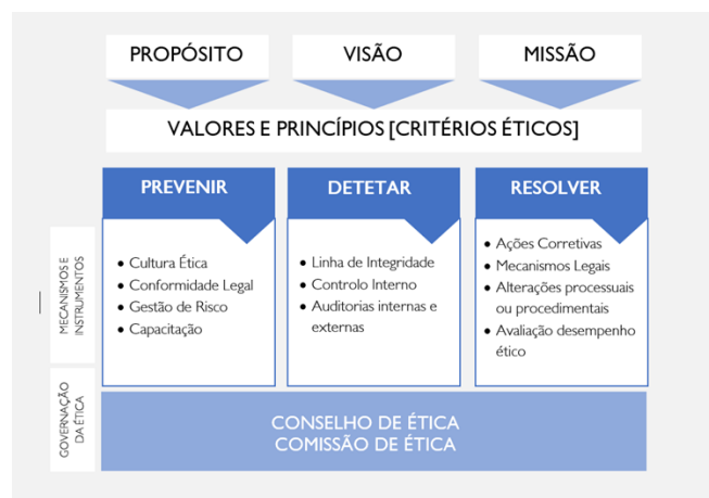
Figura I – Modelo de Integridade do Grupo AdP