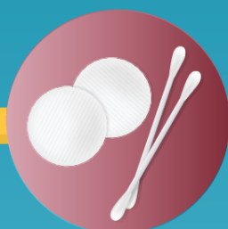
algodão e cotonetes